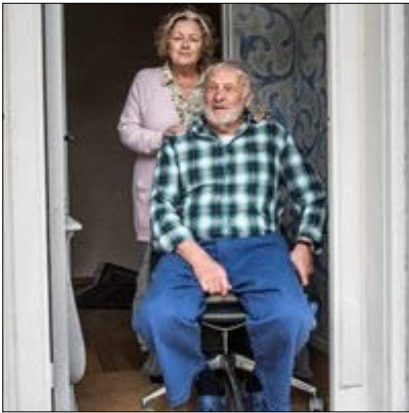
Gerda og Niller (Kirsten Lehfeldt og Niels Hausgaard)

Gerda er mor til Allan, Martin og Jacob. Hun er familiens egentlige overhoved, der samtidig holder styr på minkfarmens finanser. Hun er menneskekender og spotter lynhurtigt, hvis folk lyver, men holder også en beskyttende hånd over sin familie. Hun har en særlig evne til at tro på det bedste i sine sønner og se gennem fingrene med det lort, de laver. Inderst inde har Gerda skyldfølelse over for Martin og Allan efter sit massive alkoholmisbrug, da de var små. Et misbrug, som præsten Per hjalp hunde ud af.