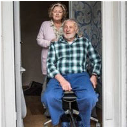
Gerda og Niller (Kirsten Lehfeldt og Niels Hausgaard)

Gerda er mor til Allan, Martin og Jacob. Hun er familiens egentlige overhoved, der samtidig holder styr på minkfarmens finanser. Hun er menneskekender og spotter lynhurtigt, hvis folk lyver, men holder også en beskyttende hånd over sin familie. Hun har en særlig evne til at tro på det bedste i sine sønner og se gennem fingrene med det lort, de laver. Inderst inde har Gerda skyldfølelse over for Martin og Allan efter sit massive alkoholmisbrug, da de var små. Et misbrug, som præsten Per hjalp hunde ud af.