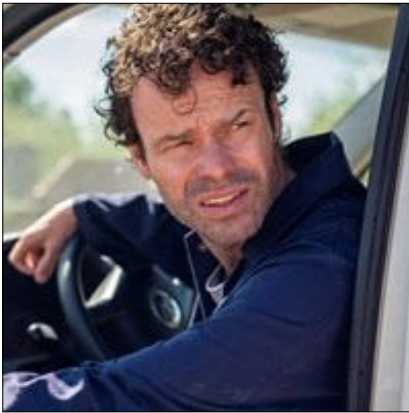
René (Mick Øgendahl)

René er en provinssmart fyr, som bor i Ringsten. Han taler gerne sig selv op og pynter på sandheden for at fremstå smartere, end han i virkeligheden er. Han kalder sig selv 'kørende sælger', men er egentlig bare kørende fiskehandler.