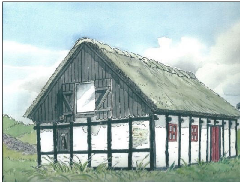
Pakhuset ved Tornby Strand

Eksporteret med sluppen Margrethe: 117 tønder byg, 10 tønder rug, 712 pund saltet flæsk, 69 fjerdinge smør og 6 levende smågrise.