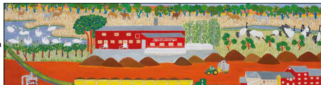
Høsten af mosen