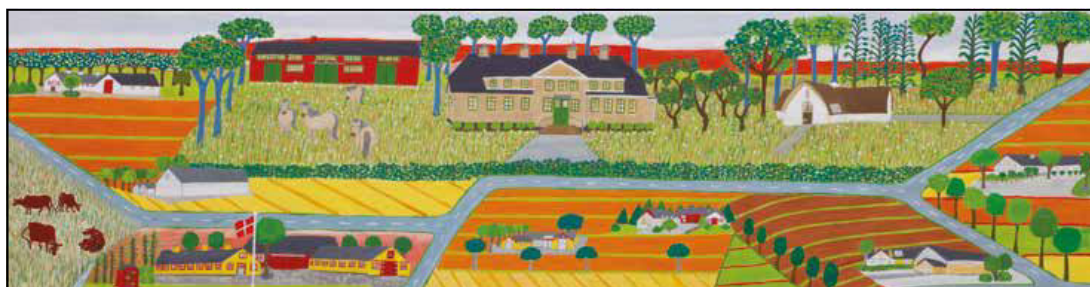
Livet i Store Vildmose