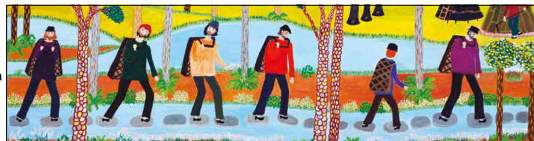
Vejen gennem mosen