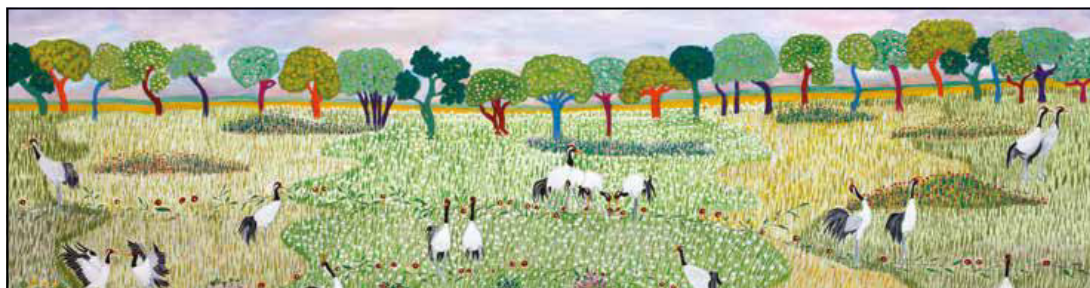
Mosen er farverig