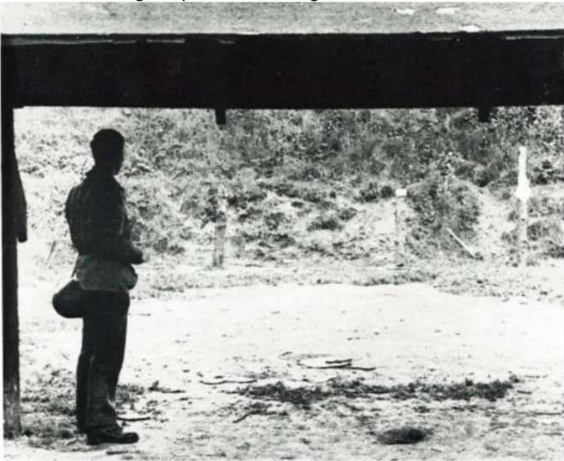
Soldat ser ud på de tre henrettelsesstolper i Ryvangen

Måske stod de og håbede på et vildt mirakel, at en engel skulle svæve ned fra himlen og forkynde, at krigen var forbi, og at de kunne gå hjem til deres familier. Måske stod de halvt bevidstløse af angst og prøvede at beherske sig, mens de frøs lidt i morgenkulden. Imens stillede den tyske henrettelsespeloton op. Soldaterne tog ladegreb og sigtede. Den tyske officer kommanderende » Feur «! En skudsalve, og derpå stilhed, morgenstilhed.