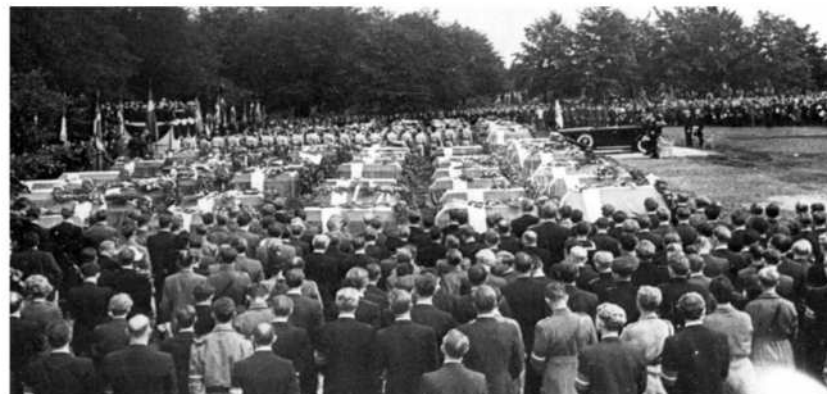
Højtideligheden med kisterne ved gravene, den 29. august 1945.