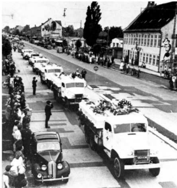
De hvide lastbiler med afdøde krigsfanger kørte gennem Danmark. Billedet er taget ved Damhustovet i Rødovre

De døde fra Tyskland kom til Danmark den 9. juli 1947, og de 26 blev begravet i Mindelunden efter en højtidelighed i Vor Frue kirke den 16. juli 1947. Senere på året kom yderligere 5 danskere hjem fra Stutthof i Polen, også de blev begravet i Mindelunden efter en højtidelighed i kapellet på Bispebjerg kirkegård den 14. december 1947.