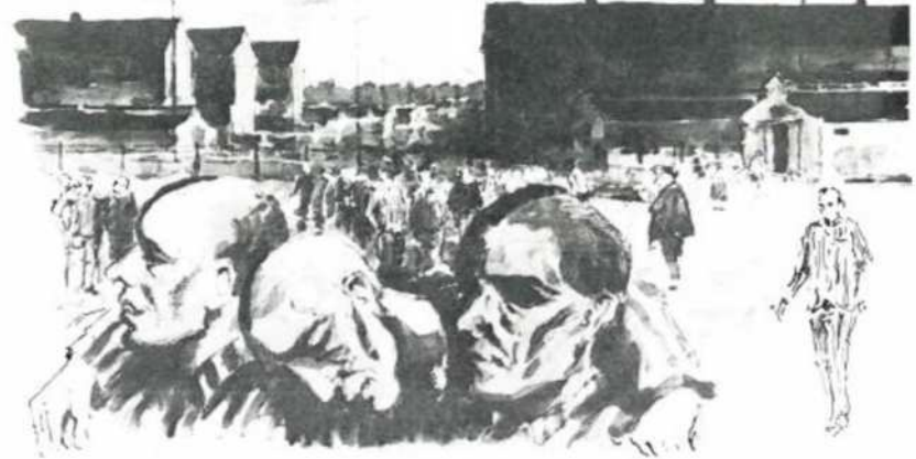
Illustration af de syge kz-fanger

»Her stod hundredvis af menneskerester i forsøg på at blive indlagt; nogle med oppustede rødviolette ansigter, øjnene var næsten lukkede af rosen, store væskende sår, flegmoner. Papirforbindingerne gav det hele et endnu mere grotesk skær, nytteløse lapperier, forbindingerne var gennemblødte, endnu inden de var viklet helt på, knuget af diarre og dysenteri, sammenkrøbne, stinkende og fortvivlede i deres elendighed. Skidtet løb ned af de mange lår, de stod i en lang række, men så man op langs rækken stod den og slingrede og vaklede som en kæmpeslange, der vred sig i døds kamp. Fødderne flyttede sig ikke, kun den evindelige rokken, aldrig i ro, ustandselig flytten af vægten fra det ene ben til det andet, kroppen vejede ikke meget, men den var en vældig belastning for de ødelagte ben. Denne hær af syge uden for revirets port er de sidste rester af et overmål af selvopholdelsesdrift, fantastisk energi og livsvilje. Hovedparten af de indlagte led af diarre, dysenteri, tuberkulose eller lungebetændelse, mange var så kraftesløse, at de ikke kunne mase til wc'erne, hvad alt bar tydeligt præg af. Adgangsbilletten til reviret var, at man havde mindst 40 i feber, det havde jeg rigeligt, så jeg blev indlagt på det utroligt overbelegte og svinagtige "sygehus"«