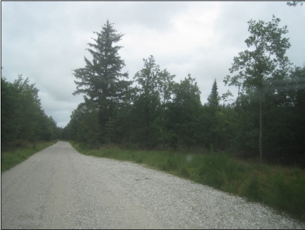
Der var ingen på besøgscenteret og der sad heller ingen i træerne ...