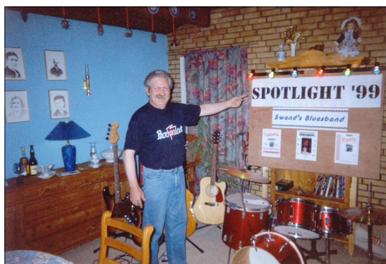
Første udgave af et ny event ta'r sin begyndelse ...

Det er vel næsten overflødigt at nævne, at vi havde en hyggelig og afstressende aften, hvor Swend's Bluesband var endog meget elektrisk.