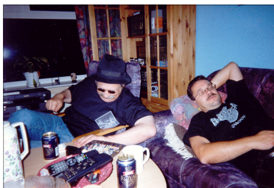
... og nærmer sig sin afslutning